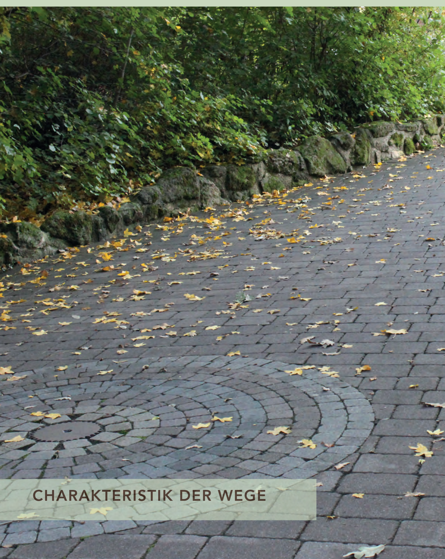
CHARAKTERISTIK DER WEGE