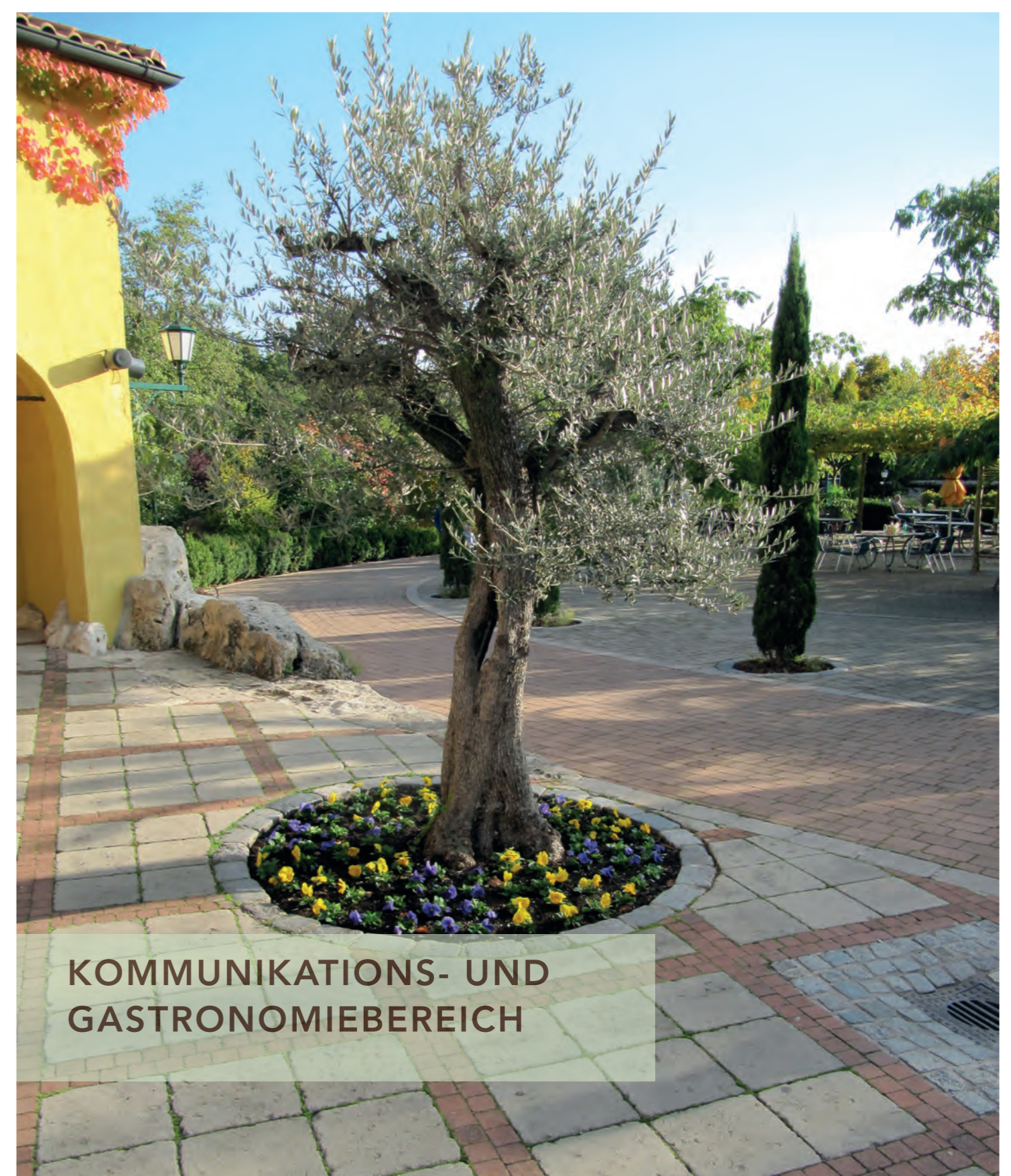
KOMMUNIKATIONS- UND GASTRONOMIEBEREICH

Der Familypark Neusiedlersee ist ein Projekt, das Stück für Stück zum größten Freizeitpark Österreichs gewachsen ist und sich sicherlich noch weiterentwickeln wird.