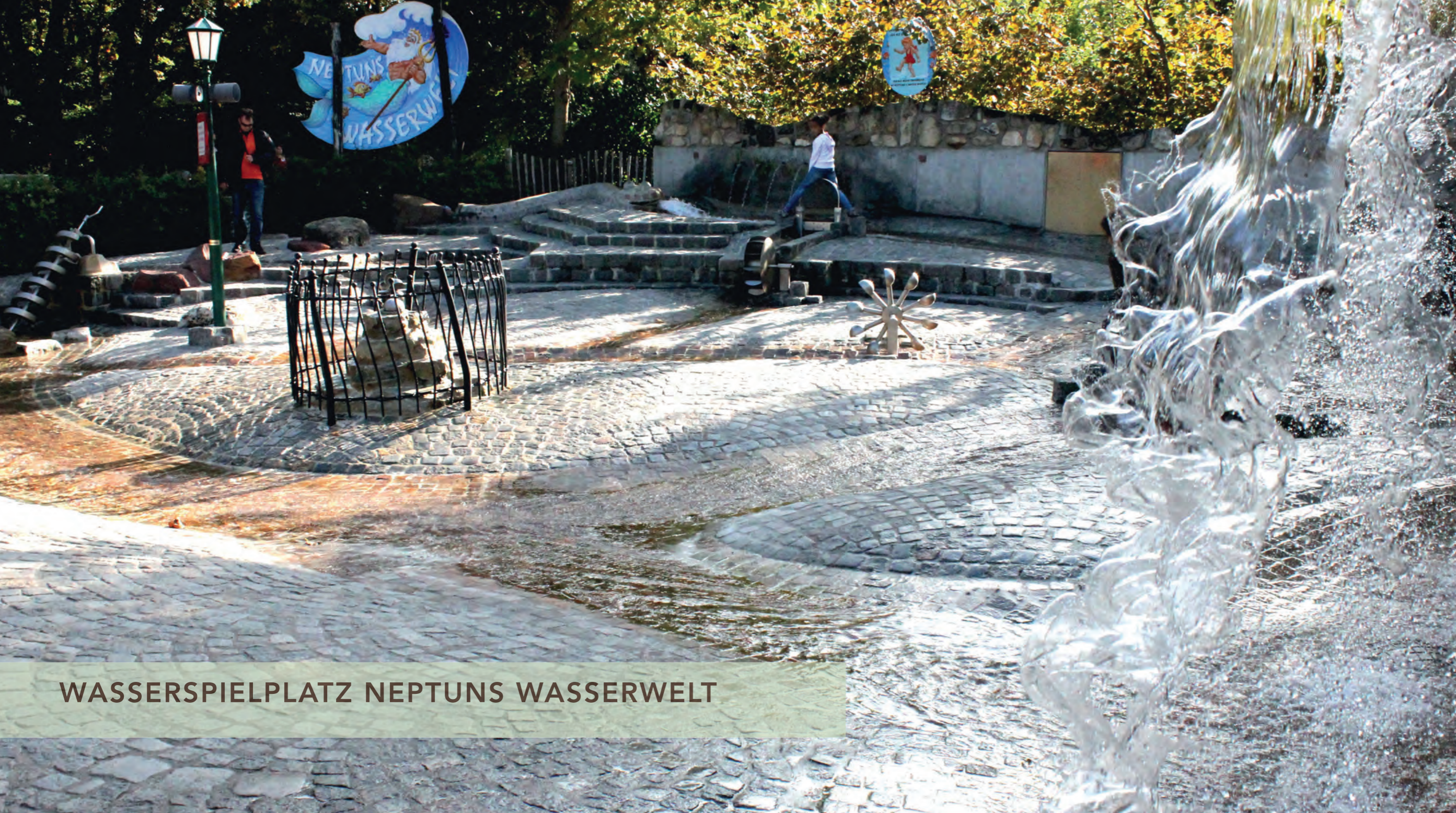
WASSERSPIELPLATZ NEPTUNS WASSERWELT