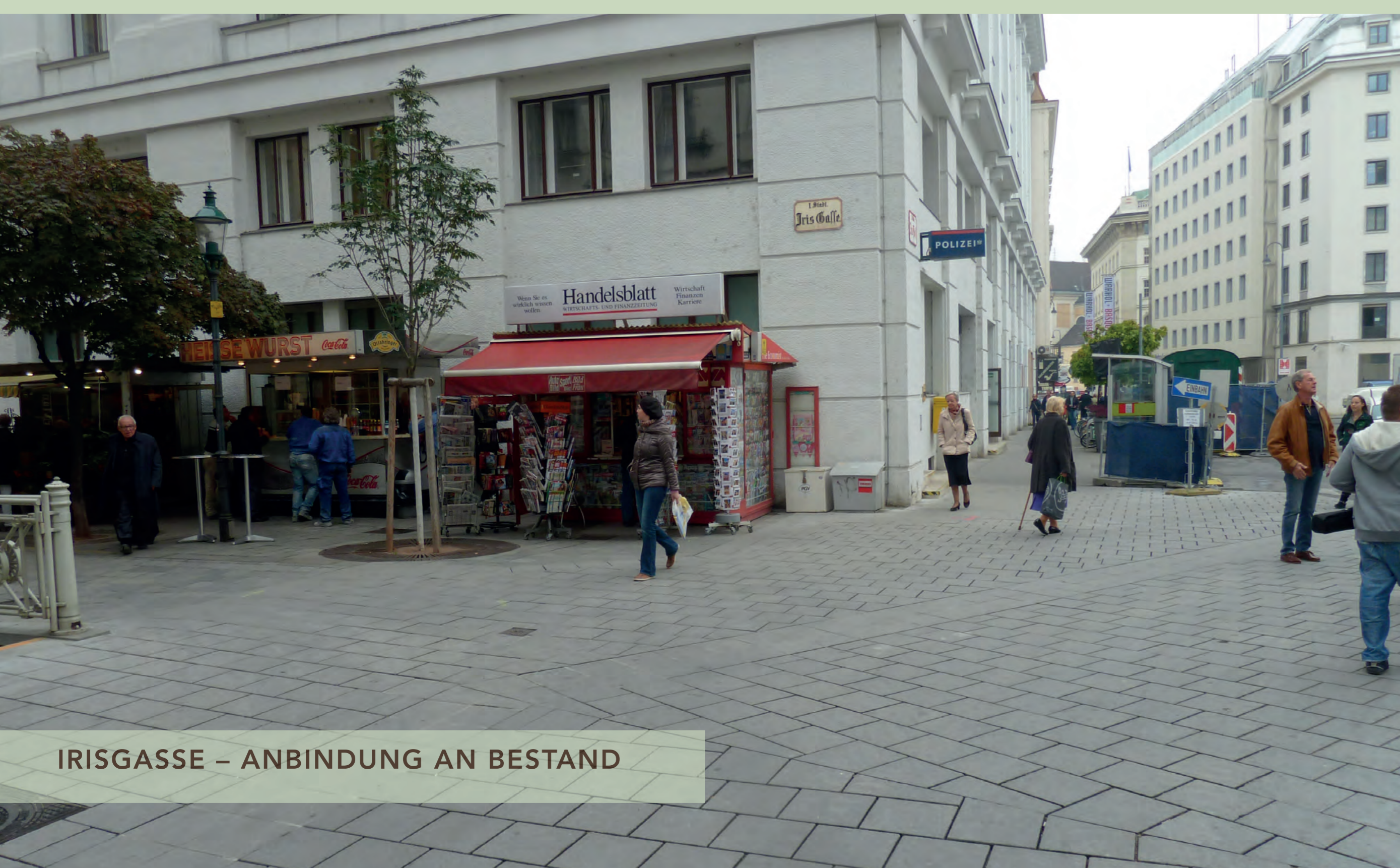
IRISGASSE – ANBINDUNG AN BESTAND