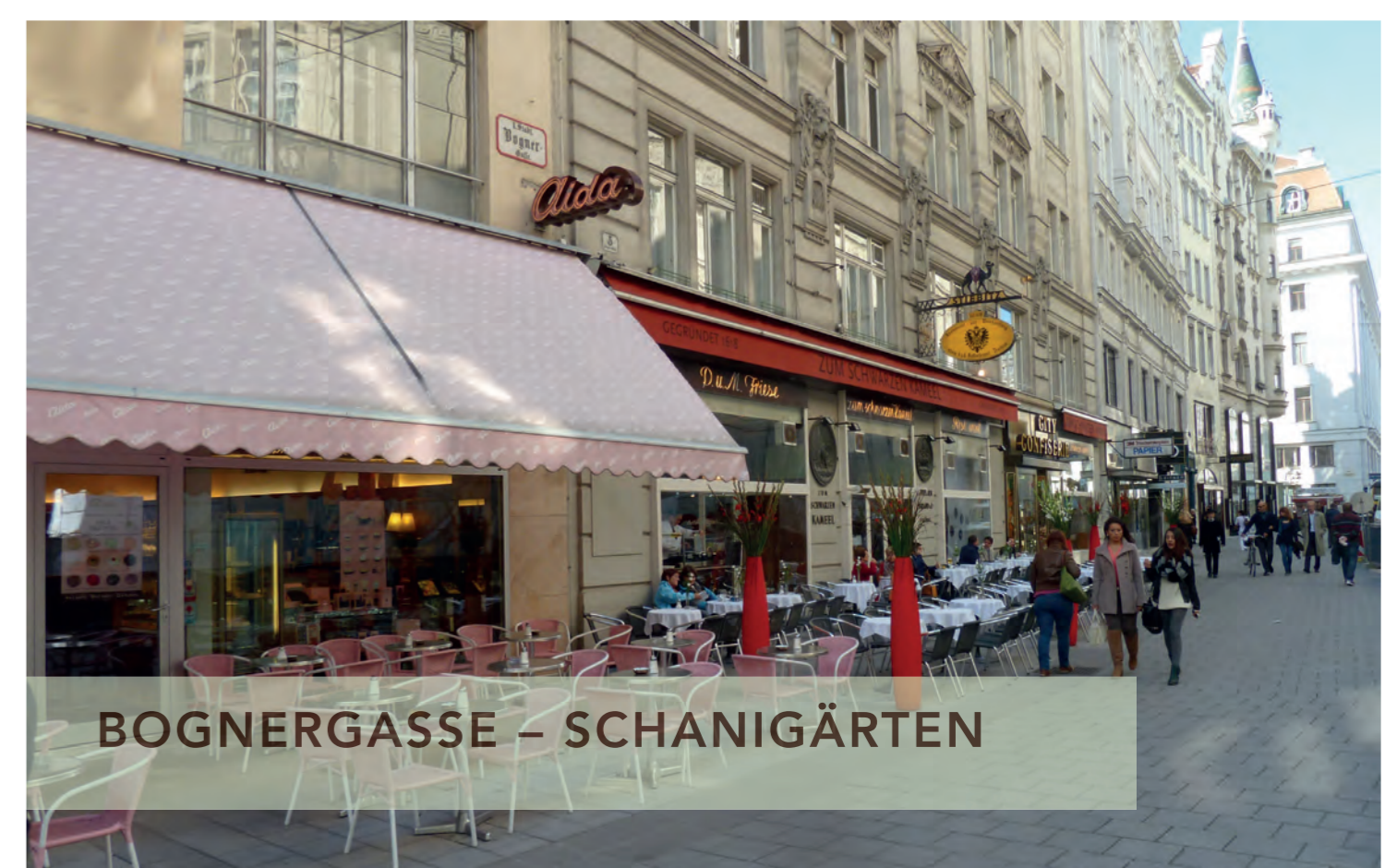
BOGNERGASSE – SCHANIGÄRTEN

Der Bauablauf und die einzelnen Bauabschnitte der Oberflächenarbeiten mussten regelmäßig abgestimmt und kurzfristig adaptiert werden.