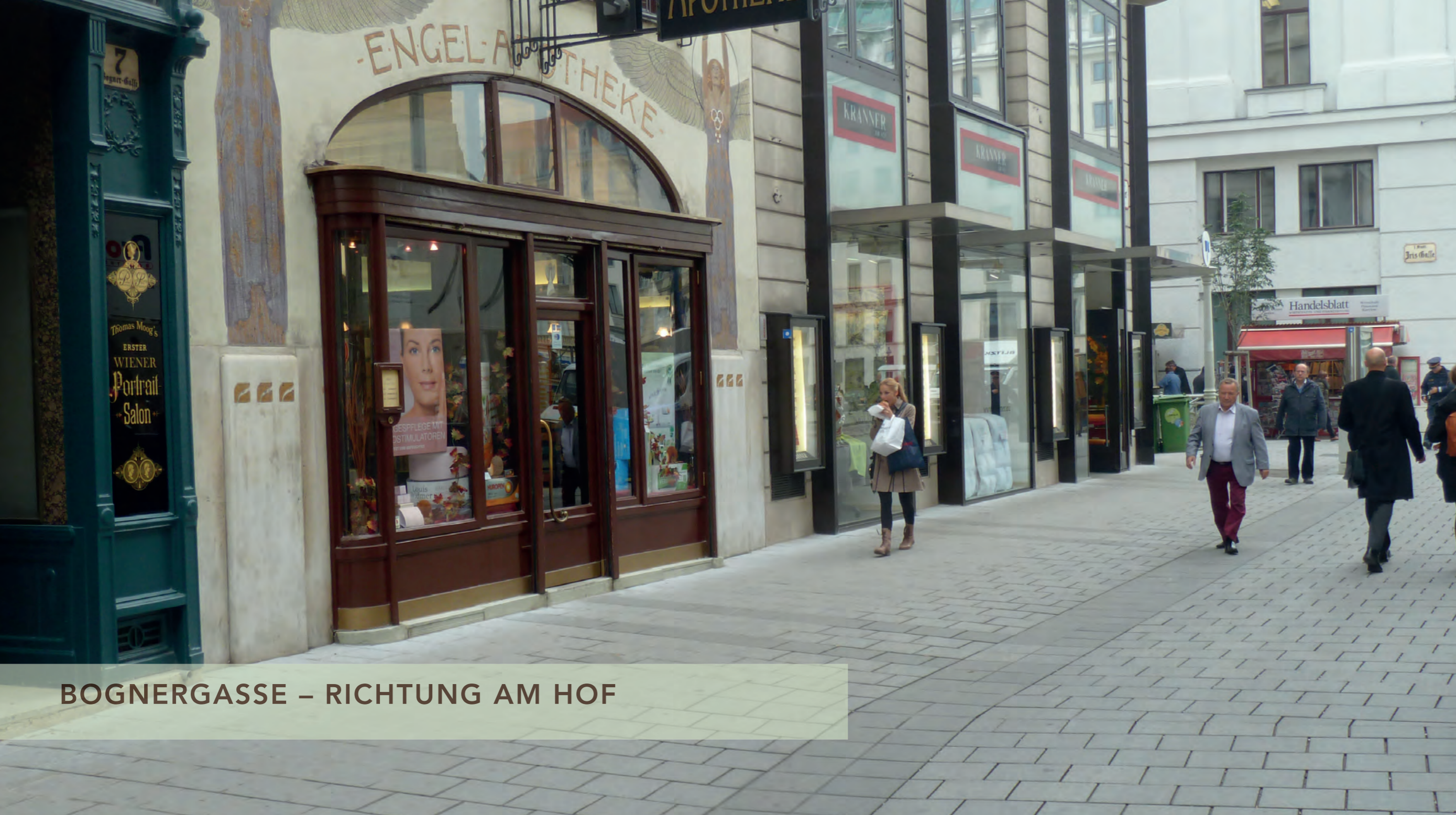
BOGNERGASSE – RICHTUNG AM HOF