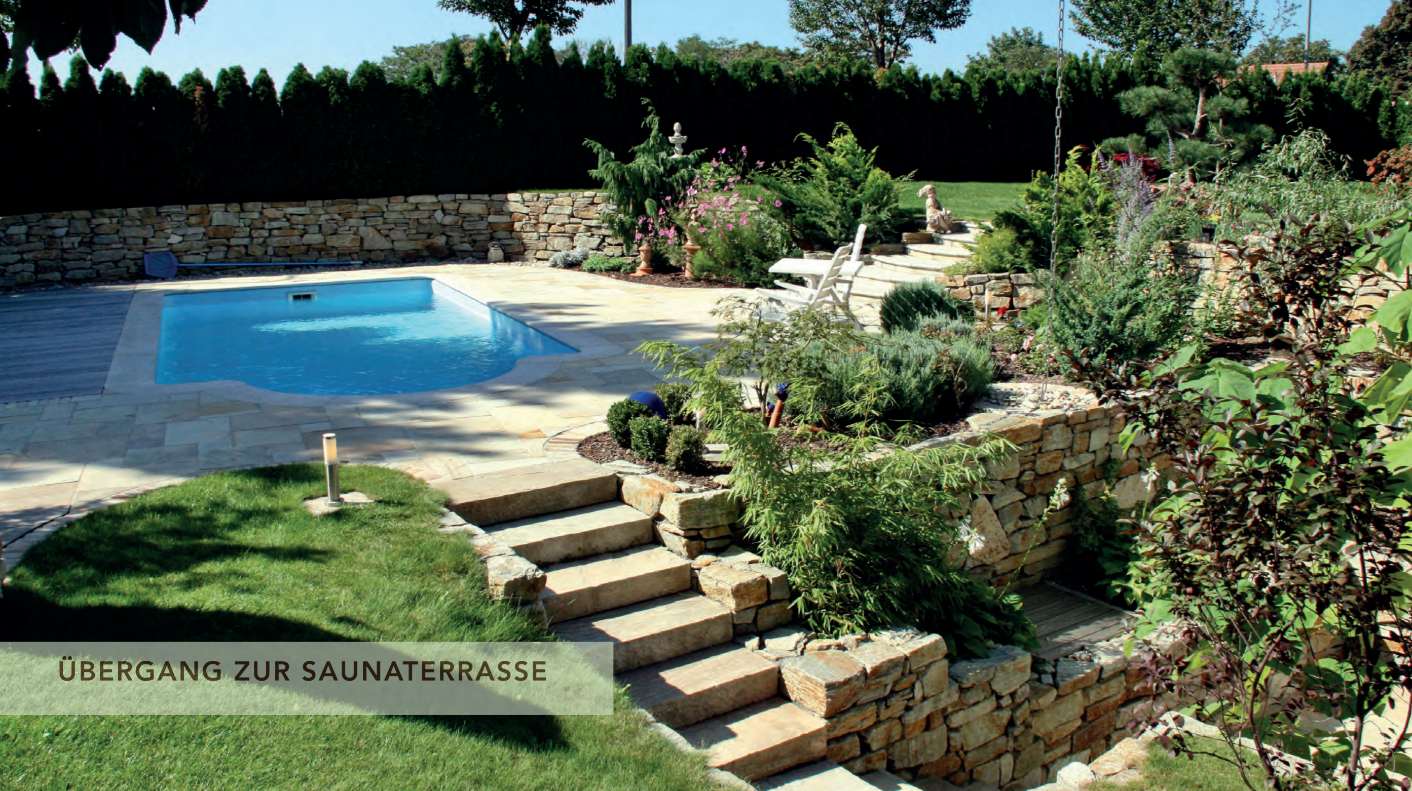
ÜBERGANG ZUR SAUNATERRASSE