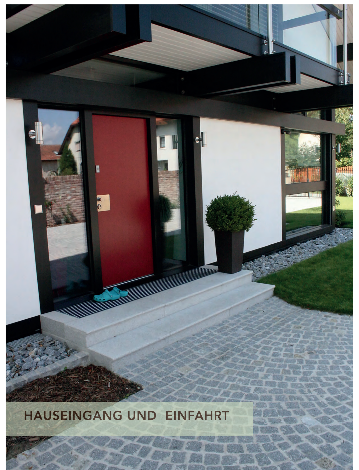
HAUSEINGANG UND EINFAHRT

Sämtliche verwendete Beläge und Wände sind natürliche und daher auch wiederverwendbare Baustoffe, einige auch aus Österreich.