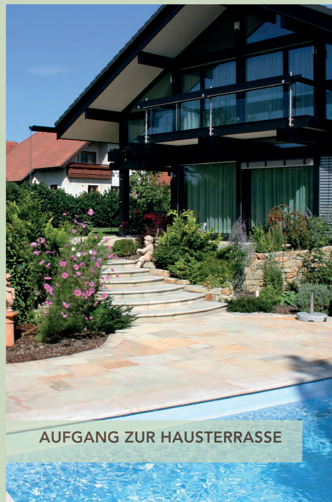
AUFGANG ZUR HAUSTERRASSE