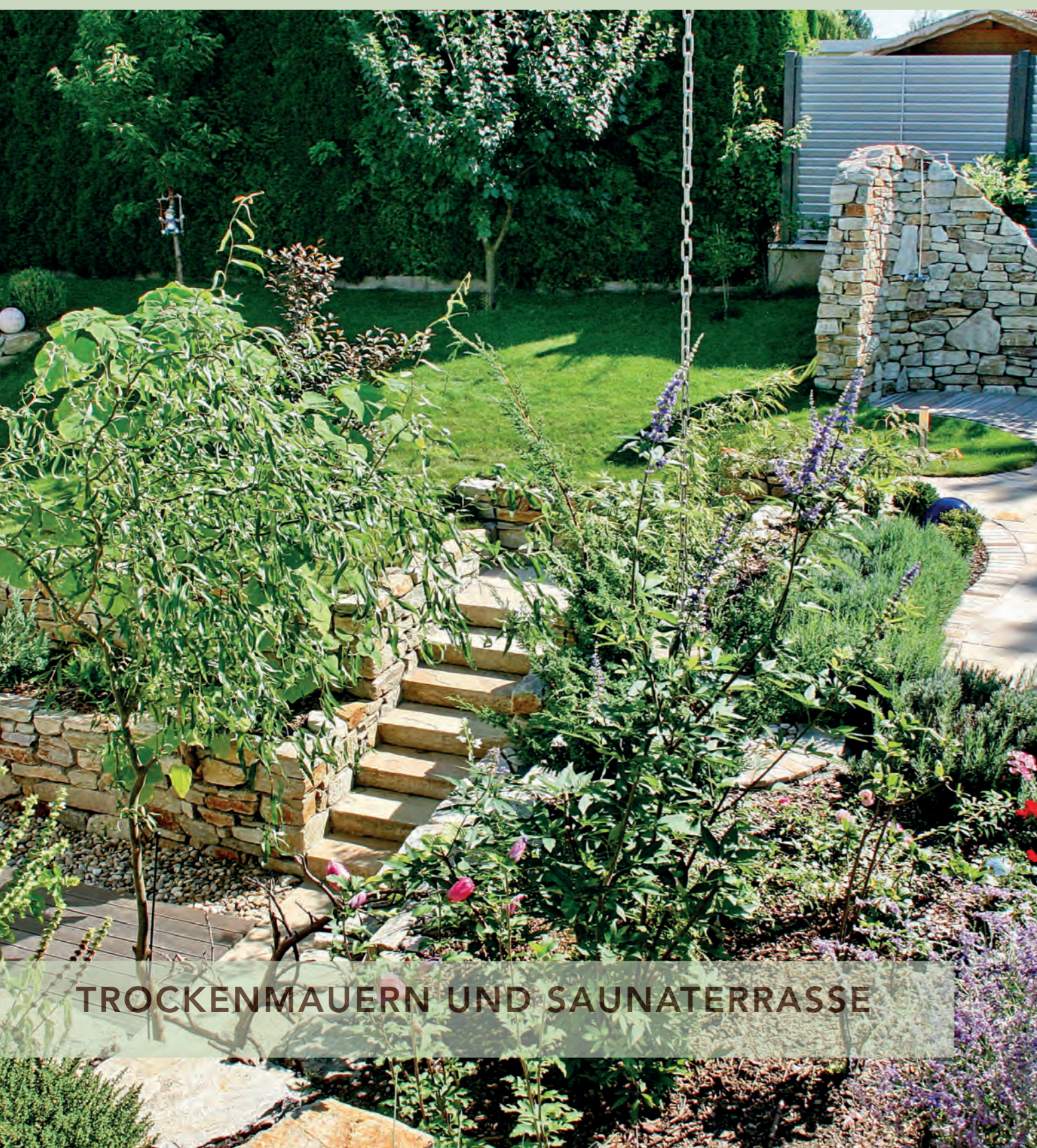
TROCKENMAUERN UND SAUNATERRASSE