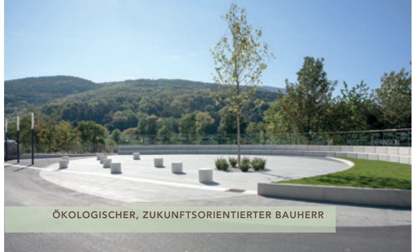
ÖKOLOGISCHER, ZUKUNTSORIENTIERTER BAUHERR