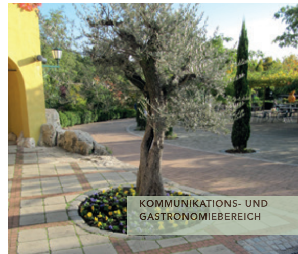
KOMMUNIKATIONS- UND GASTRONOMIEBEREICH