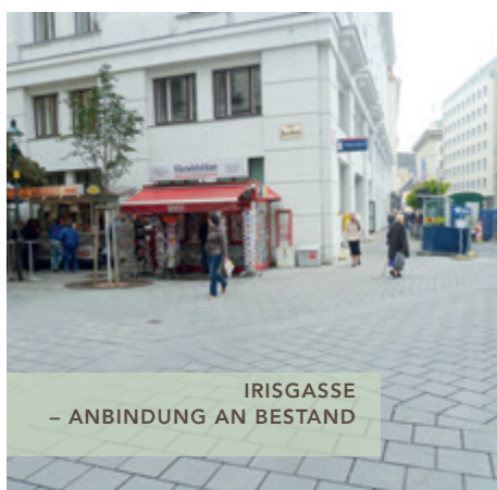
IRISGASSE – ANBINDUNG AN BESTAND

Das Gestaltungskonzept wurde in enger Abstimmung mit der MA 19, der MA 28 und der MA 33 entwickelt und orientiert sich einerseits an der angrenzenden Bebauung und andererseits an der funktionellen Aufteilung des Querschnittes für Fußgänger (einkaufen, shoppen, etc.), Schanigärten, der Befahrbarkeit für die Feuerwehr und den Lieferverkehr.