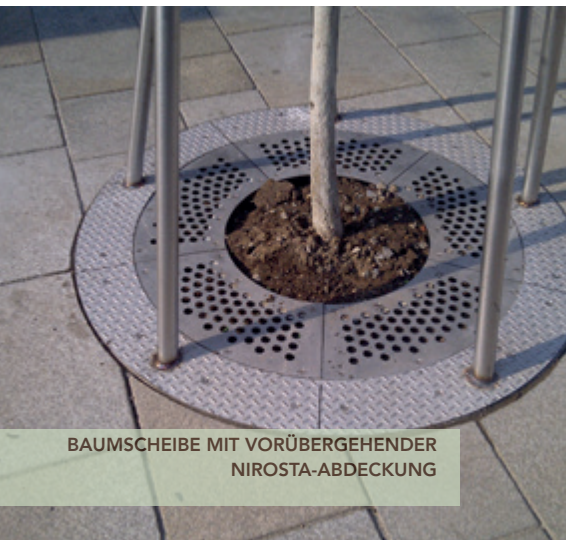
BAUMSCHEIBE MIT VORÜBERGEHENDER NIROSTA-ABDECKUNG