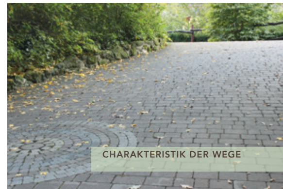
CHARAKTERISTIK DER WEGE