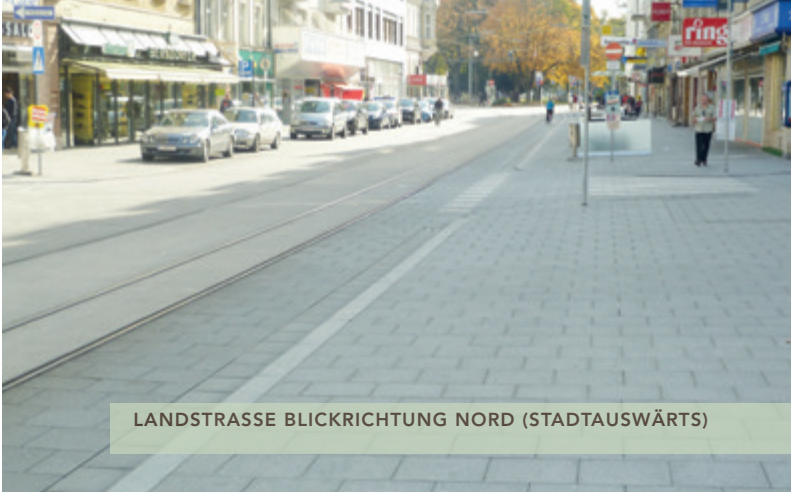
LANDSTRASSE BLICKRICHTUNG NORD (STADTAUSWÄRTS)