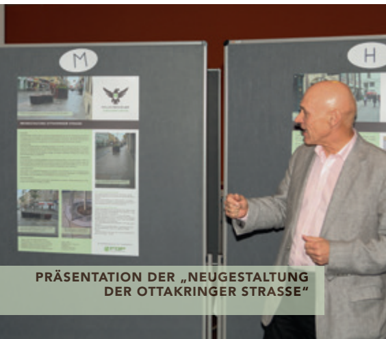
PRÄSENTATION DER „NEUGESTALTUNG DER OTTAKRINGER STRASSE“