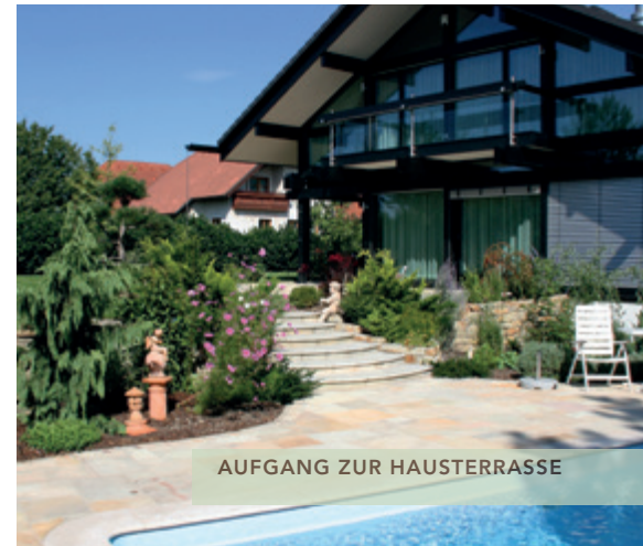
AUFGANG ZUR HAUSTERRASSE