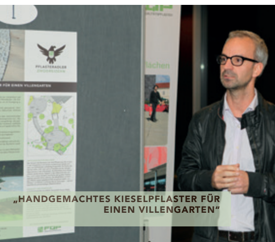
„HANDGEMACHTES KIESELPFLASTER FÜR EINEN VILLENGARTEN“