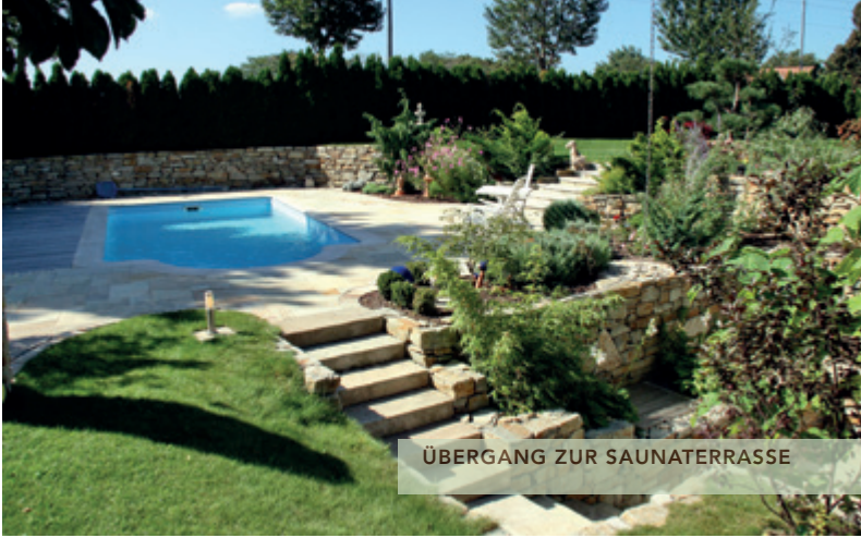
ÜBERGANG ZUR SAUNATERRASSE