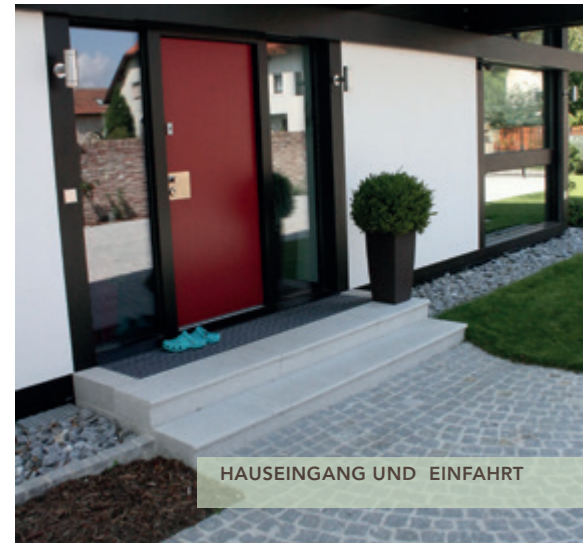
HAUSEINGANG UND EINFAHRT