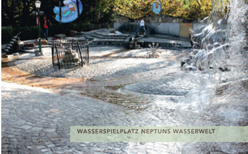
WASSERSPIELPLATZ NEPTUNS WASSERWELT