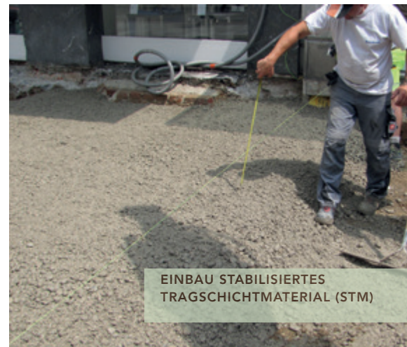
EINBAU STABILISIERTES TRAGSCHICHTMATERIAL (STM)

Bauherr: Magistrat der Landeshauptstadt Linz Architekt/Planer: KMP ZT-GmbH. Technische Planung: TBV Niedermayr GmbH. Ausführende Firma: West-Asphalt Straßenbau-ges.m.b.H., Wels Bauaufsicht TBV Niedermayr GmbH.