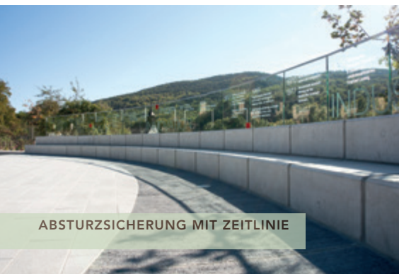
ABSTURZSICHERUNG MIT ZEITLINIE

Fläche: ~ 720 m 2 Auftragssumme: € 420.000 Projektbeginn: 5.10.2012 Baubeginn: 22.7.2013 Fertigstellung: 12.09.2013