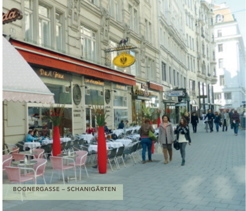
BOGNERGASSE – SCHANIGÄRTEN