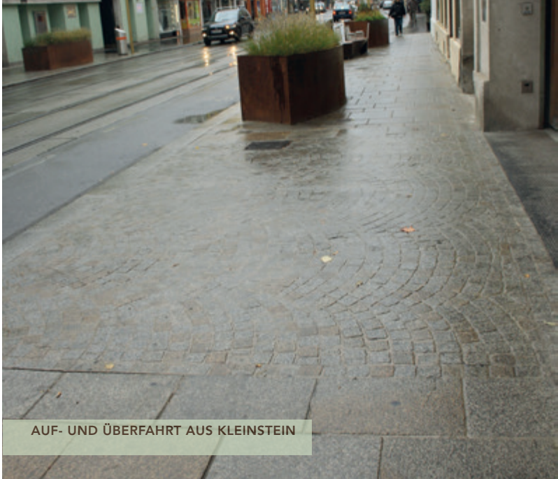
AUF- UND ÜBERFAHRT AUS KLEINSTEIN