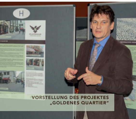
VORSTELLUNG DES PROJEKTES „GOLDENES QUARTIER“