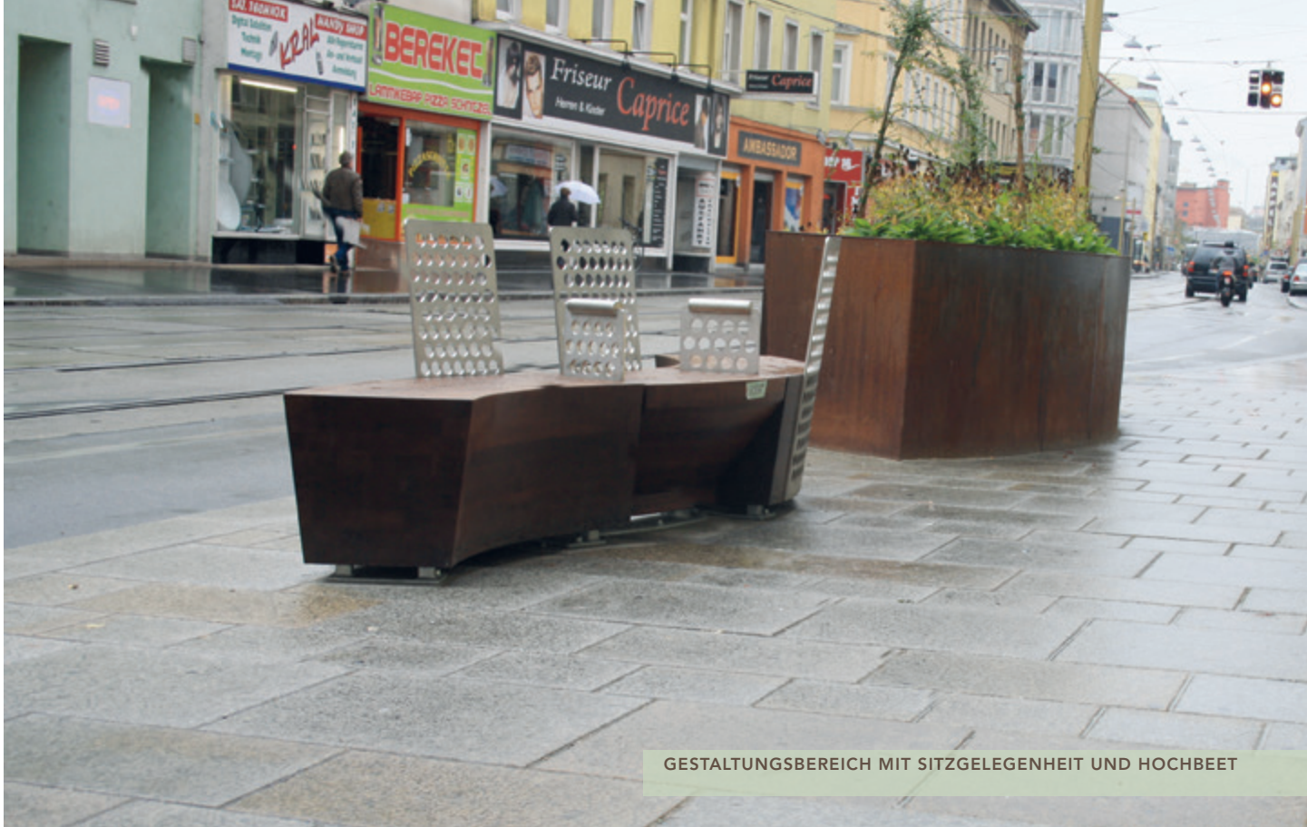
GESTALTUNGSBEREICH MIT SITZGELEGENHEIT UND HOCHBEET

Die hohe Funktionalität wurde durch neue gesicherte Fußgängerübergänge, dem Durchziehen der Gehsteige bei nicht ampelregulierten Quergassen, der Anordnung von Gestaltungsbereichen (verbreiterte Gehsteige mit Sitzgelegenheiten) und einer Tempo- und Lärmreduktion durch Reduktion der Autofahrspuren erreicht.