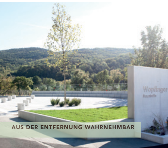
AUS DER ENTFERNUNG WAHRNEHMBAR