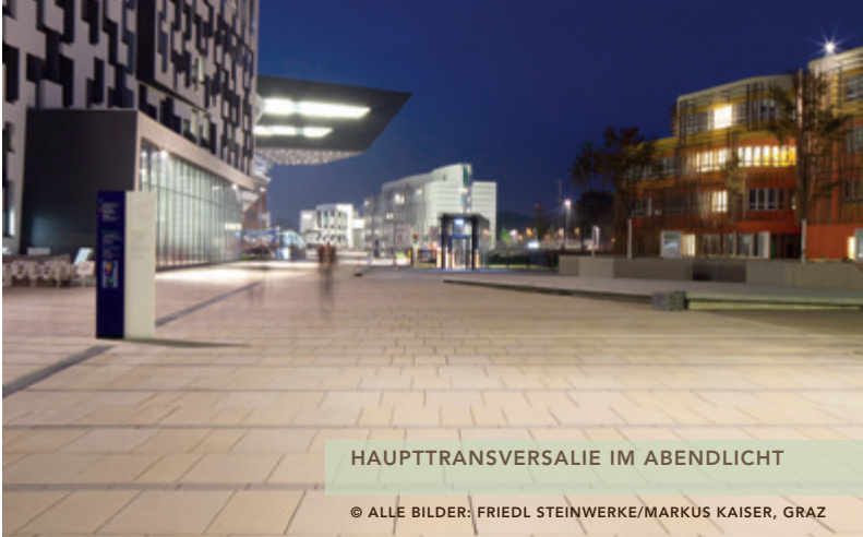
HAUPTTRANSVERSALIE IM ABENDLICHT