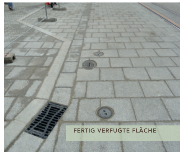
FERTIG VERFUGTE FLÄCHE

Fläche: 7.000 m 2 Auftragssumme: € 2,7 Mio. brutto Projektbeginn: 2011 Baubeginn: 03/2012 Fertigstellung: 11/2012